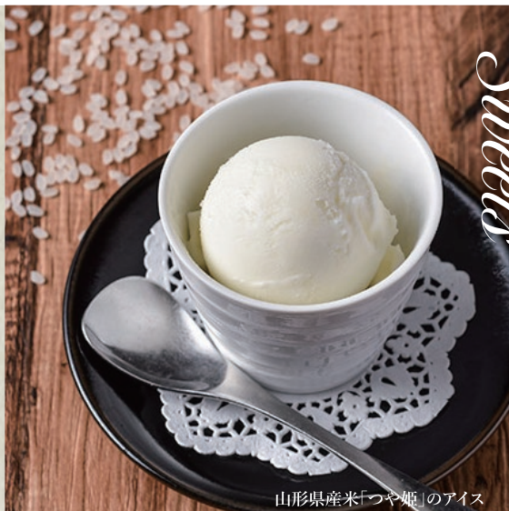
山形県産米「つや姫」のアイス