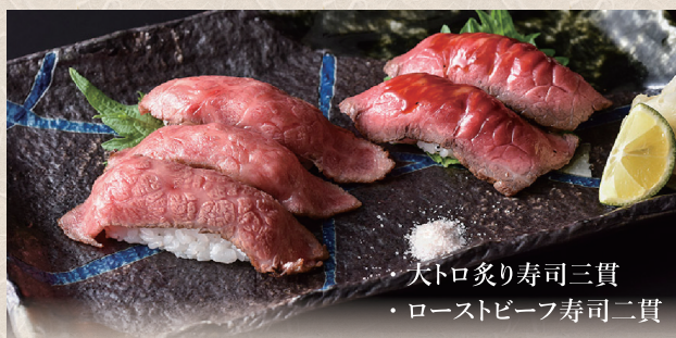
大トロ炙り寿司三貫 ・ローストビーフ寿司二貫