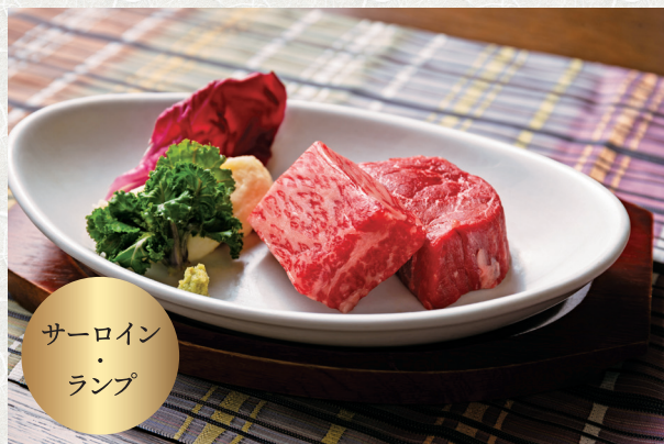
サーロイン ランプ