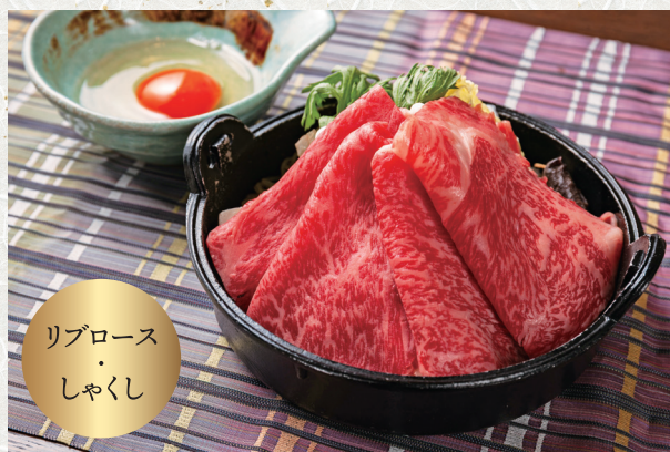
リブローズ しゃくし