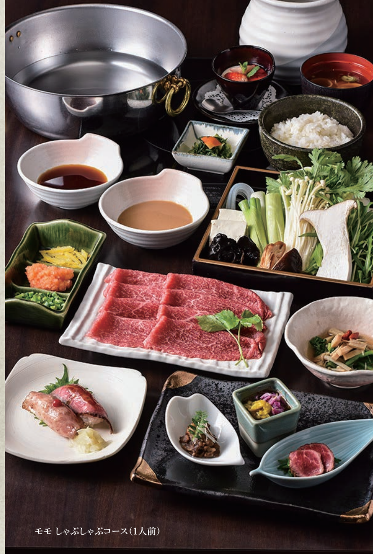
モモしゃぶしゃぶコース(1人前)