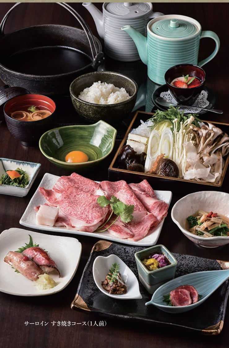
サーロイン すき焼きコース(1人前)