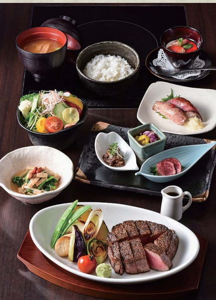
フィレステーキコース(1人前)