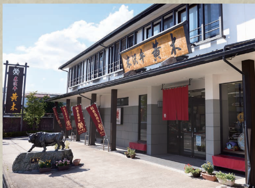
米沢牛黄木 総本店 山形県米沢市桜木町 3-41