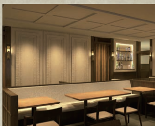
米沢牛黄木 東京駅店 [東京駅グランスタ八重北内]