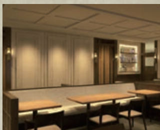
米沢牛黄木 東京駅店 [東京駅グランスタ八重北内]