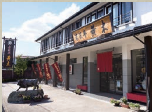
米沢牛黄木 総本店 山形県米沢市桜木町 3-41